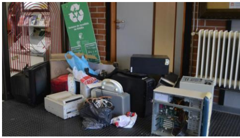
A sétima Semana de Recollida de RAEE permitiu reunir 75 aparellos.