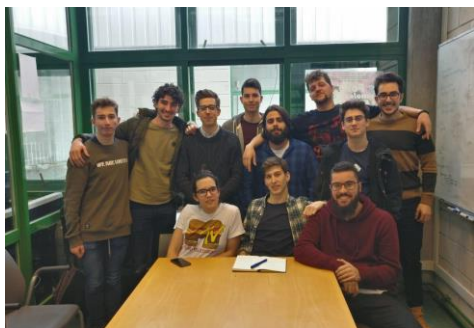
Foto de grupo do equipo de coordinación do foro