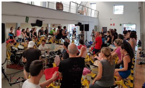
A Área de Benestar, Saúde e Deporte ofrece este cuadrimestre unha ampla programación.