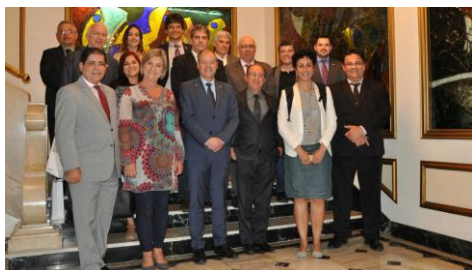
Foto de familia dos e das participantes nesta xuntanza de traballo.