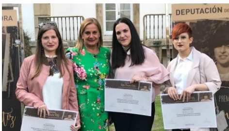
A entrega dos Premios Sofía Novoa pon en valor a investigación en prol da igualdade.