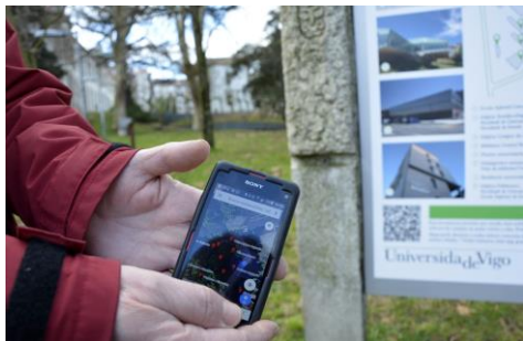
As persoas interesadas poderán recoñecer a través dos seus móbiles as especies existentes