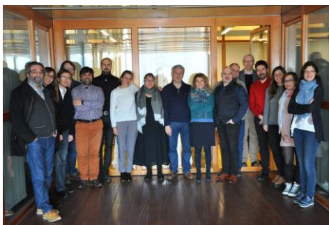
Representantes das entidades participantes no proxecto que estes días se reuniron no campus de Vigo