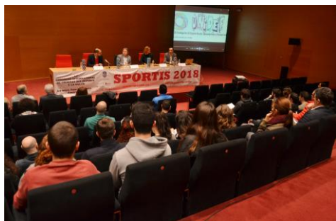
O pazo da Cultura de Pontevedra acolle o XIV Congreso Internacional de Ciencias do Deporte e da Saúde..

Comunicar ciencia, divulgar coñecemento e poñer en valor o papel da investigación no desenvolvemento social e humano. Para visibilizar estes aspectos, o certame de divulgación Somos Científicos uniu entre o 16 e o 27 de abril 30 expertos e expertas de todo o Estado con estudantes de 85 centros de ensino de España e de países suramericanos. Organizado pola organizado por Fecyt e La Caixa, tratábase de interaccionar, de abrir liñas de diálogo en liña, de solucionar dúbidas e dar respostas a estes rapaces e rapazas sobre temas como alimentación, saúde, enerxía, nanotecnoloxía, robótica, química, bioloxía, etc. Os propios estudantes foron os encargados de elixir ao científico ou científica favorita. +info.