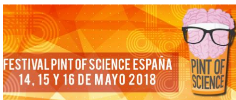
O festival internacional de divulgación científica desenvolverase os días 14, 15 e 16 de maio.