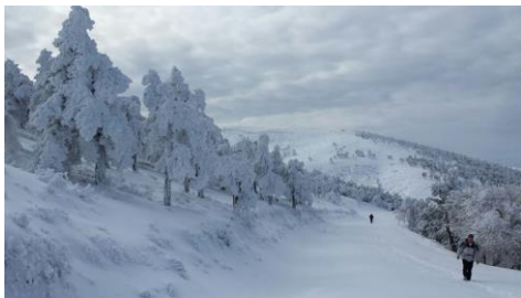
O sábado 17 de febreiro celebrárase unha nova andaina universitaria