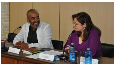
Expertos lusófonos participan no campus nun seminario sobre investigación en xénero.

Implicar a múltiples axentes nunha reflexión conxunta sobre os diferentes factores que inciden na exclusión social e educativa co proposto de definir, desde unha perspectiva cidadá e comunitaria, solucións innovadoras para realidades concretas como o abandono e o fracaso escolar ou as repercusións da violencia machista na infancia. Esta é a base do proxecto Redes de innovación para la inclusión educativa y social , que o grupo de investigación Cies (Colaboración, Innovación e Investigación para a Equidade Socio-educativa), da Facultade de Ciencias da Educación e do Deporte, desenvolve conxuntamente con investigadores e investigadoras das universidades de Cantabria, País Vasco e Sevilla. +Info