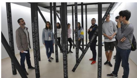
Alumnado do CPI José García de Mende achégase ao campús para coñecer a Sala Alterarte.

"Pint of Science 2018, o festival de divulgación científica internacional que propón un encontro entre investigadores e o público nos bares, chega os días 14, 15 e 16 de maio a 56 cidades de España, coa novidade de incluír a Ourense dentro deste universo singular. A cuarta edición segue batendo marcas: 308 eventos en 105 bares, coa participación de 730 científicos como relatores e case 400 voluntarios na organización". Deste xeito, preséntase por primeira vez en Ourense unha cita na que terán protagonismo destacado físicos e historiadores do campus. +Info