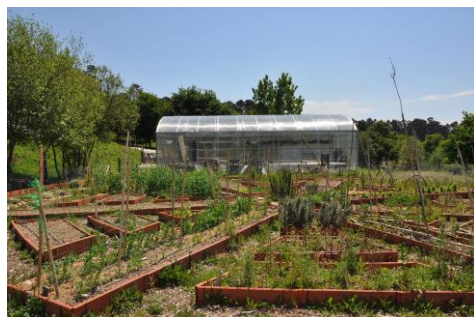
15 alumnos e alumnas participaron nun obradoiro práctico sobre agricultura sostible.