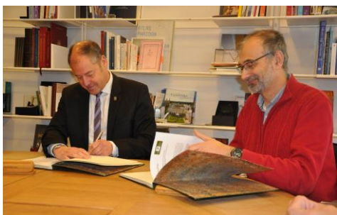
Mato e Abad asinan o convenio de colaboración.

O Consello de Goberno aprobou por unanimidade na súa sesión deste luns o 1º Plan de divulgación científica da Universidade, que marca as liñas estratéxicas no que respecta á política e difusión da actividade investigadora da institución para este ano 2018 e co que se persegue, non só contribuír a un mellor coñecemento da capacidade investigadora da institución, senón sobre todo fomentar a mellora da cultura científica na sociedade. +info