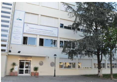
O carácter internacional da escola queda visible desde a propia fachada do centro