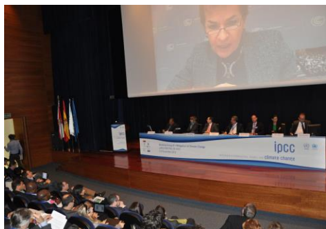
O grupo 3 do IPCC reuniuse en Vigo en novembro do ano 2012

“Robótica, programación, termografía infravermella, deseño 3D, nanopartículas, extracción de ADN, utilidades da tinta invisible, identificación de patoloxías autoinmunes... Detrás das disciplinas científicas e tecnolóxicas agóchanse infinidade de recunchos nos que atopar a vocación laboral. Pero en moitas destas profesións os homes son maioría e isto perpetúa un nesgo de xénero que segue a condicionar, en boa medida, a elección dos estudos entre o alumnado do ensino secundario. +Info