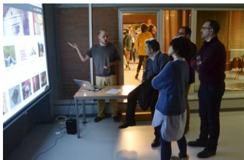
O alcalde e a edil de Promoción Económica coñeceron a web que promociona o traballo do alumnado