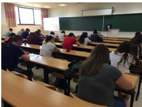
Alumnado do Centro de Linguas durante a realización dunha proba de nivel.