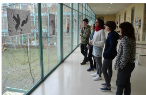
A exposición xa pode verse no primeiro andar da Facultade