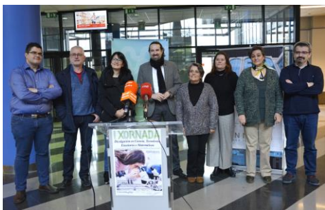
Será na I Xornada de Divulgación en Ciencia, Tecnoloxía, Enxeñaría e Matemáticas, presentada este martes