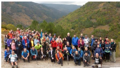
780 participantes nas rutas culturais deste curso.