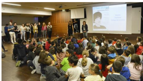
En homenaxe a unha mestra amante da lingua galega.