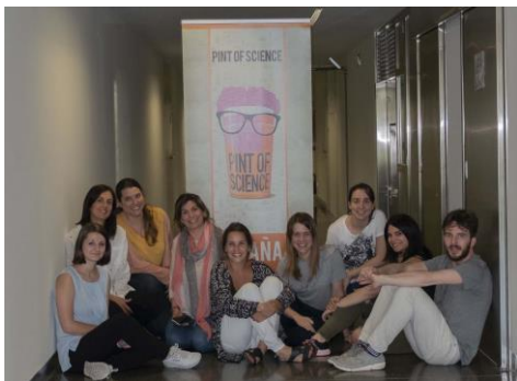
As e os investigadores de Cinbio encargados da organización do evento en Vigo..