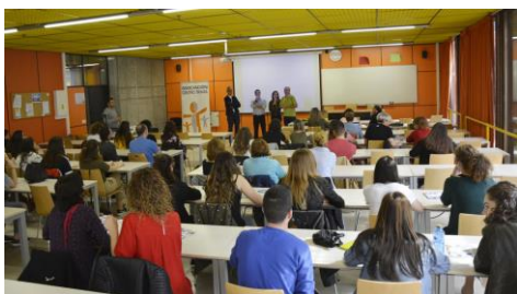
A intervención con menores infractores, a debate en Ciencias da Educación.