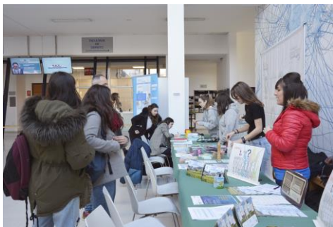
O Edificio Xurídico-Empresarial acolleu a primeira das nove sesións deste cuadrimestre