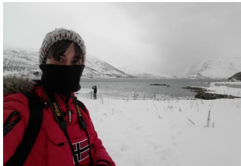
A científica atópase facendo unha estada de investigación en Noruega.