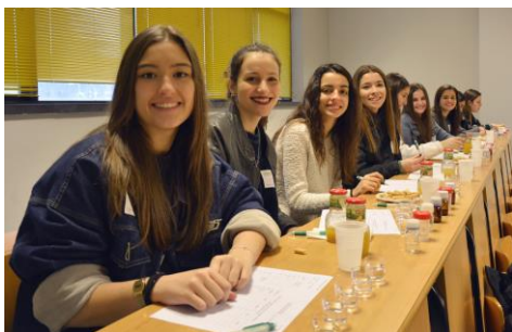
O campus de Ourense abriu este venres as súas portas a 300 escolares da provincia