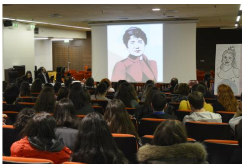
O campus de Ourense sumouse este martes á conmemoración do día da escritora galega