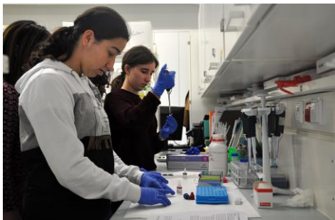
Participantes no obradoiro de detección do factor reumatoide