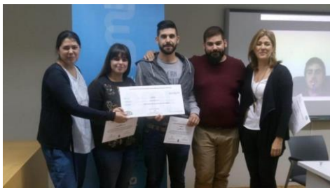
Unha nova e sostible vida para a canteira de Richinol.

O día 22 de xuño comezan as vacacións para as e os escolares e agora é o momento para pais e nais de buscar alternativas para ocupar o tempo das e dos máis pequenos da casa. Para os membros da comunidade universitaria, a Universidade de Vigo organiza cada ano o Campus Camp , un campamento que ofrece aos participantes diversión e aprendizaxe durante os meses de verán ao mesmo tempo que se achegan á institución na que traballan os seus proxenitores. +Info