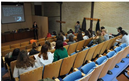
Ofreceu un relatorio este martes na Facultade de Filoloxía e Tradución dentro das actividades da Unidade de Igualdade