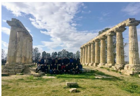
O Regresan os 30 membros da comunidade universitaria que participaron na IX Viaxe de Estudos Arqueolóxicos