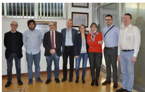
Participantes da xuntanza esta semana en Vigo

Co obxectivo sempre presente de fomentar os hábitos de vida saudables entre a comunidade universitaria, a Área de Benestar, Saúde e Deporte volve a ofrecer un cuadrimestre máis unha ampla oferta de actividades coas que pretende deixar sen escusas a aquelas e aqueles que non inclúen a actividade física na súa axenda semanal. Alumnado, persoal docente e investigador e persoal de administración e servizos ten a oportunidade de ter desde clases de zumba a adestramento personalizado en pequenos grupos. +info