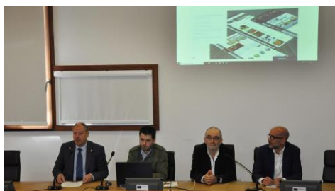
Unha nova web á comunicación que sitúa as persoas usuarias no centro.