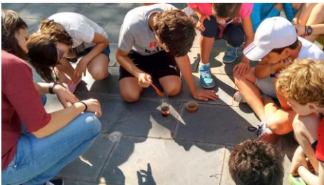
O campus Camp oferta 36 prazas en Ourense.

Máis dunha decena de ordenadores e monitores, seis impresoras, dous televisores, outras dúas aspiradoras..., e así ata un total de 75 electrodomésticos e dispositivos que serán trasladados a unha empresa autorizada na xestión deste tipo de residuos. Este é o balance que deixou a sétima edición da Semana de Recollida de RAEE (Residuos de Aparellos Eléctricos e Electrónicos), unha iniciativa impulsada ao abeiro do proxecto Green Campus que ten como obxectivo principal concienciar á comunidade universitaria da importancia do correcto tratamento do lixo no que rematan converténdose diferentes equipamentos que funcionan con electricidade ou con pilas e baterías. +Info