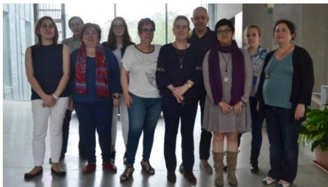
Redes cidadáns para atopar respostas innovadoras á exclusión social.