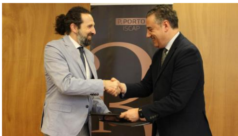
O campus da Auga estreita lazos co Instituto Superior de Contabilidade e Administración do Porto.