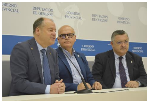
Este martes asináronse dous convenios de colaboración entre a Universidade e a Deputación.