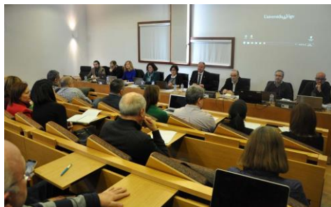
O Consello de Goberno aprobou por unanimidade na súa sesión deste luns o 1º Plan de divulgación científica da Universidade

Interconectar recursos, realidades, obxectos e vincular contextos, co obxectivo de desenvolver narrativas da historia, que lle contén algo novo ou que lle deixen un espazo aberto á reflexión ás e aos consumidores de bens culturais. Con esta filosofía púñase en marcha a mediados do ano 2016 o proxecto europeo Crosscult , no que once socios europeos, entre eles a Universidade de Vigo, acadaron unha subvención de máis de 3,5 millón de euros, co obxectivo de mellorar o coñecemento de Europa a través da conexión dos seus bens culturais. Ano e medio despois do seu inicio, o proxecto celebrou, desde o pasado mércores e este venres, unha xuntanza no campus de Vigo, na que se exploraron as posibilidades de transferencia e colaboración durante o que será o derradeiro ano do proxecto, que rematará en febreiro de 2019. +info