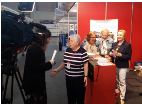
A través dun posto propio na feira e de diversas conferencias.

O alumnado dos cursos intensivos de verán do Centro de Linguas poderá optar por primeira vez a bolsas cunha contía equivalente ao 75% do importe da matrícula dos estudos, que se impartirán os meses de xuño e xullo deste ano. Ata o 25 de maio poden presentarse as solicitudes a esta nova convocatoria que, segundo a vicerreitora de Estudantes en funcións, Dolores González, ten o obxectivo de "mellorar as competencias lingüísticas do alumnado que participe en programas impartidos total e parcialmente nunha lingua estranxeira, de xeito que a lingua vehicular non sexa un obstáculo para a adquisición do coñecemento, ou, en programas de mobilidade. +Info