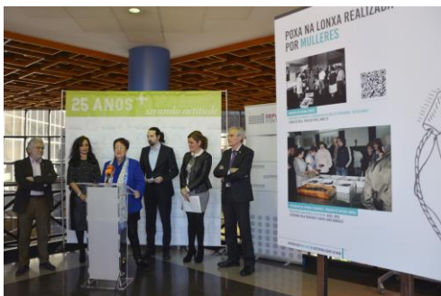
Este mércores inaugurouse no campus a exposición Sustentabilidade en feminino