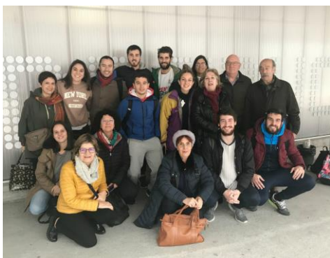
Foto de grupo do alumnado de grao e sénior que participou nesta iniciativa