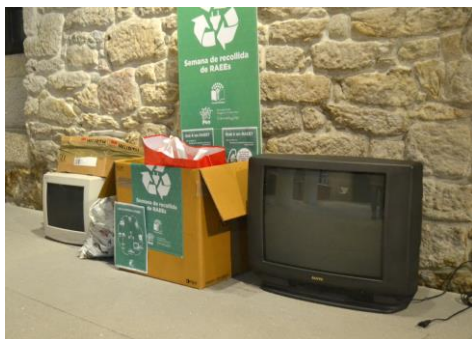
Algúns dos obxectos depositados na Casa das Campás

Desde o ano 2007, o campus de Ourense conta coa chamada Ruta das Árbores, un percorrido que pretende dar a coñecer a gran variedade de especies procedentes de todo o mundo presentes nos xardíns universitarios, algunhas consideradas senlleiras polo seu porte ou idade. Co obxectivo de dinamizar esta ruta, as persoas interesadas poden xa recoñecer a través dos seu teléfono móbiles e de códigos QR ubicados no campus as árbores existentes e acceder a información sobre elas. +info