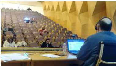
O reitor negociará coa Xunta a posibilidade de desenvolver actividades nos campus desde o 7 de setembro

A Escola Infantil Concepción Saiz Otero do campus de Ourense ten aberto o prazo para solicitar unha das súas 41 prazas que para o curso 2020/2021. Á convocatoria poden presentarse membros da comunidade universitaria, que terán preferencia na concesión e condicións vantaxosas, pero tamén residentes e traballadores da cidade que non teñan vinculación coa institución académica. As solicitudes, tanto de renovación como de adxudicación de nova praza, poderán presentarse ata o día 25 de xuño de 2020 a través da sede electrónica da Universidade de Vigo. +info .