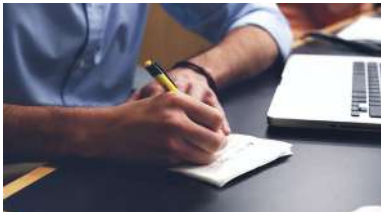
Nas últimas semanas puxéronse en marcha preto dunha ducia de actividades formativas nas que se matricularon máis de 700 persoas