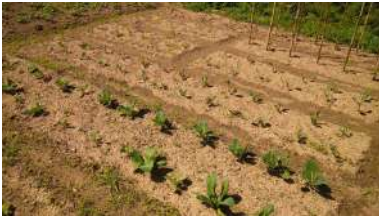
Investigadores, asociacións e cooperativas reuníranse no Congreso Internacional de Agroecoloxía os días 2 e 3 de xullo