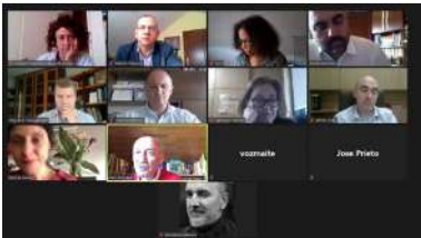
Imaxe do encontro virtual.