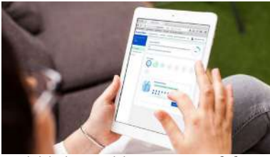
Na iniciativa participan 42 emprendedores e nove mentores