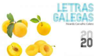
O acto poderá seguirse a través de Campus Remoto

A suspensión da actividade presencial nos campus por mor da crise da COVID-19 non impedirá que, como é habitual, a Universidade de Vigo celebre o Día das Letras Galegas, que neste 2020 dedícase ao filólogo e escritor Ricardo Carvalho Calero. Afondar, desde diferentes perspectivas, na figura e traxectoria do homenaxeado será de feito o obxecto central do acto virtual que a institución académica desenvolverá este venres ás 12.00 horas e que poderá seguirse a través do Campus Remoto e de UVigoTV . +info.