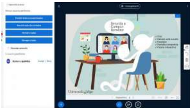
Os despachos permiten tamén realizar gravacións

O Servizo de Prevención de Riscos Laborais remarca, no seu manual para teletraballar dende a casa de forma saudable, a necesidade organizar o tempo e facer os descansos precisos na xornada laboral. Desda necesidade nace a nova iniciativa da Área de Benestar, Saúde e Deporte, un proxecto saudable que consiste en realizar pausas activas que se retransmitirán en directo a través das redes sociais. +info.