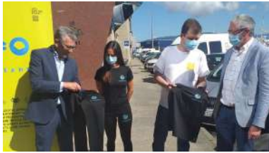
Imaxe da presentación.