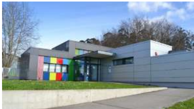
O centro contará o vindeiro curso con 53 prazas