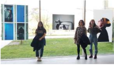
Alumnas que participaron en 2019 na exposición Sen Moldes , unha das das actividades financiadas con estas axudas