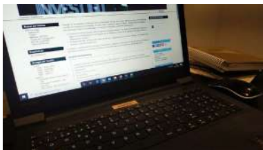
O repositorio institucional contén máis de 1400 traballos científicos, na súa gran maioría teses