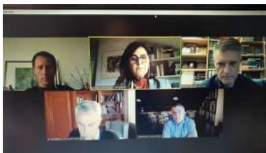
Captura da conferencia

En abril de 2019 púxose en marcha o proxecto internacional Oceanets , que ten entre os seus obxectivos “prever a perda de redes de pesca e avaliar a posibilidade de utilizar aparellos inservibles e outros residuos plásticos recuperados do mar para reciclalos e aproveitálos na produción de fibras téxtiles de alta calidade coas que fabricar produtos de interese para a industria téxtil”. Un ano despois, a iniciativa ten recollido 30 toneladas de refugallo de pesca e presenta o seu primeiro prototipo de roupa deportiva fabricada con este tipo de fibras téxtiles de reciclaxe. +info .