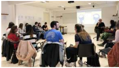
Imaxe de arquivo do Obradoiro de Mindfulness do que nace esta aula virtual