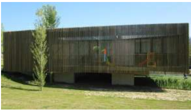
A actividade no centro comezará o 1 de setembro

A Unidade de Igualdade destinará este ano preto de 20.000 euros en axudas dirixidas a promover a “mirada lila”, tanto nas actividades docentes como en todas aquelas que contribúan á sensibilización en materia de xénero e a transmisión de valores igualitarios na Universidade de Vigo. Subvencionaranse en total 18 actividades que, debido ás actuais circunstancias sanitarias, se celebrarán maioritariamente en liña, organizadas por persoal docente e investigador dos tres campus. +info .