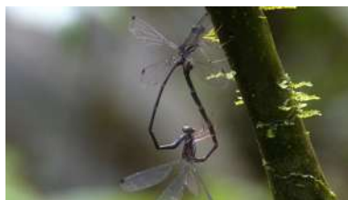
Dous exemplares de ' Philogenia gaiae ', durante unha cópula.

A crise da COVID-19 non vai impedir que a formación en idiomas que cada verán ofrece o Centro de Linguas se desenvolva nos vindeiros meses. Os cursos intensivos, de entre dúas e catro semanas de duración abertos tanto á comunidade universitaria como á cidadanía en xeral para aprender ou mellorar a competencia en idiomas estranxeiros, impartiranse de xeito virtual. +info.