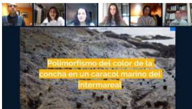
As presentacións arrancaron cun traballo sobre o polimorfismo da cor da concha nun caracol mariño

Son pioneiros na participación neste programa, por iso o seu exemplo vai servir de guía para todas as alumnas e alumnos interesados en participar no denominado STEMBach , Bacharelato de Excelencia en Ciencias e Tecnoloxía , unha iniciativa impulsada pola Xunta de Galicia e á que a Universidade de Vigo se uniu desde o primeiro momento. Os institutos A Sangriña de A Guarda e Plurilingüe A Paralaia de Moaña foron dous dos centros que primeiro se uniron a esta experiencia. +info .