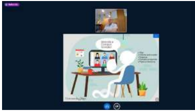
O Consello de Campus de Pontevedra celebrou a súa sesión a través do Campus Remoto