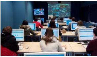
Imaxe dunha aula CeMIT