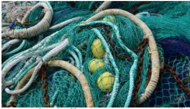
Desenvolverán fibras e revestimentos téxtiles biodegradables e biorreciclables para os aparellos e prendas