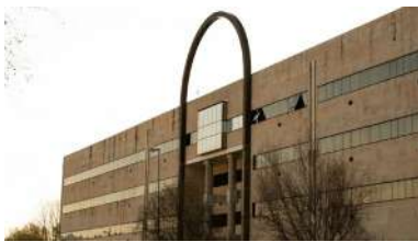
A titulación impártese na Facultade de Ciencias Sociais e da Comunicación