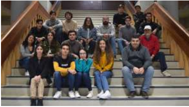
Participantes neste proxecto de aprendizaxe-servizo