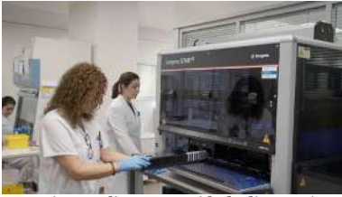
Permite ampliar a capacidade diagnóstica a través do procesamento agrupado de mostras PCR