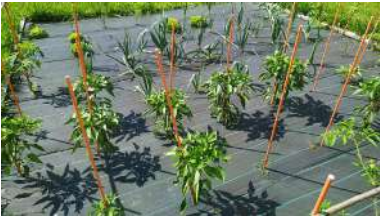
Celebrarase entre o 1 e o 3 de xullo cun récord de participantes, 250 persoas