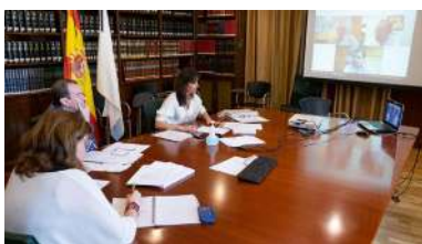
Un intre da reunión entre a Consellería e os reitores

ERTES, despidos, redución de ingresos... o impacto do confinamento decretado polo estado de alarma dende o 14 marzo nas economías familiares está a ter un impacto directo moi grave sobre a renda das familias. Para tratar de paliar os efectos que estas circunstancias poidan ter no rendemento académico do alumnado, a Universidade de Vigo acaba de lanzar unha convocatoria de axudas urxentes e excepcionais para o estudantado afectado polas consecuencias económicas da declaración do estado de alarma que lle impida ou dificulte a continuidade dos seus estudos. +info.