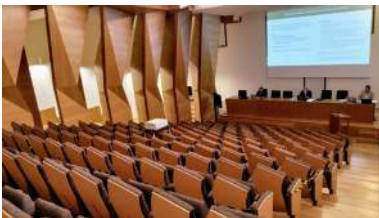
Imaxe da primeira sesión de Consello de goberno virtual

O Centro de Investigación Mariña, a través da Ecimat e a súa participación na Rede Europea de Estacións de Bioloxía Mariña (EMBRC-ERIC), participa xunto con outras 12 infraestruturas de investigación europeas nun proxecto H2020 denominado EOSC-LIFE (European Strategy for Research Infrastructures). Estas 13 institucións de I+D do eido da saúde e da alimentación unen os seus coñecementos e esforzos para crear un espazo dixital aberto e colaborativo para as ciencias da vida na nube, o que será a European Open Science Cloud (EOSC). +info .