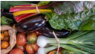
Os días 5, 12 e 19 de xuño a través de Campus Remoto

A declaración da pandemia da COVID-19 trincou o desenvolvemento, entre outras moitas cousas, dos proxectos das e dos emprendedores xurdidos da comunidade universitaria. Co obxectivo de axudarlles a continuar desde a casa as súas ideas de negocio, a Área de Emprego e Emprendemento da Universidade de Vigo puxo a disposición deste colectivo a posibilidade de empregar a plataforma dixital de incubación Bridge for Billions . +info.