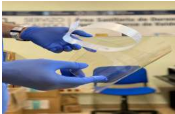
En toda España a produción superou as 236.000 unidades

Hai máis dunha década que a Vespa velutina chegou accidentalmente a Europa procedente do sudeste asiático. A súa expansión foi rápida e efectiva en países como Francia, España e Portugal, os máis afectados por esta especie invasora no continente. Actualmente pódese atopar en case todas as rexións da área atlántica e representa unha ameaza para a biodiversidade xa que é un importante depredador de abellas e outros polinizadores. +info.